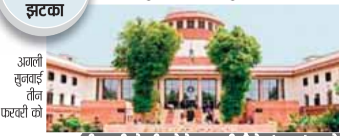
अगली सुनवाई तीन फरवरी को

शीर्ष कोर्ट ने बंगाल सरकार और राज्य के डीजीपी से मांगा हलफनामा, अदालत ने कहा सीसीटीवी फुटेज, दस्तावेज सुरक्षित रखें