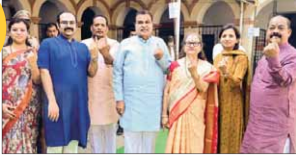
केंद्रीय मंत्री नितिन गडकरी समेत कई दिग्गज अंगुली की स्याही दिखाते हुए